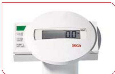
Para comprobar el BMI, simplemente se presiona una tecla.

En hospitales y consultorios médicos es absolutamente necesario poder evaluar el estado nutricional del paciente. Para estos fines, la pesapersonas seca 769 ofrece una función IMC que mide el contenido de grasa corporal en relación a la estatura. La función auto-HOLD también alivia la tarea diaria: se ocupa de seguir indicando el resultado en la báscula ya descargada. Esto permite atender debidamente al paciente antes de anotar el peso. Con la función TARA, se compensan los pesos adicionales que no deben incluirse en el resultado de pesaje.