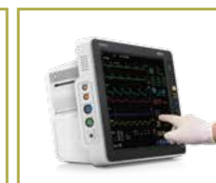
Interfaces fáciles de usar