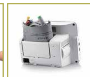
Gabinete exclusivo para accesorios