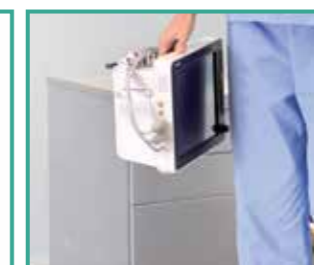
Protección contra caídas