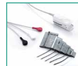
Accesorios de alta calidad