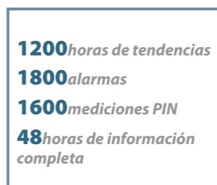
Enorme capacidad de datos