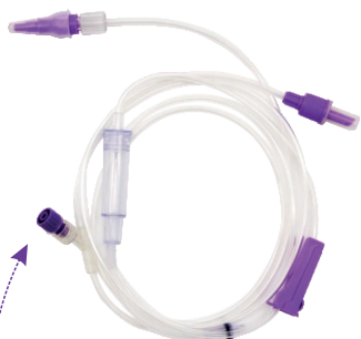
Set de Administración Enteral(Punzón)