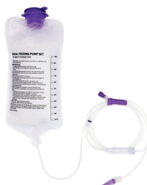
Set de Administración Enteral(Bolsa)