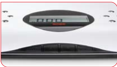
La disposición de las teclas impide su accionamiento involuntario durante el proceso de medición.