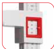
Dos grandes ventanas y escalas en ambos lados facilitan la lectura.