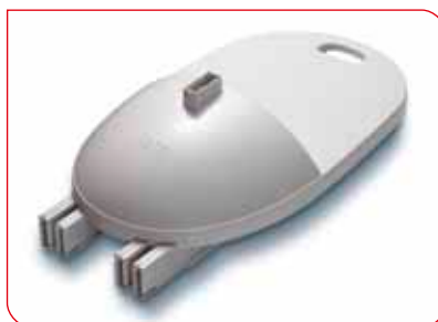
Asa integrada y bloqueo seguro de todas las piezas para un transporte sencillo.